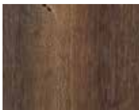
OAK VINTAGE INTENSE Hoboken

Embossed surface technology in cooperation with J Grabner GmbH