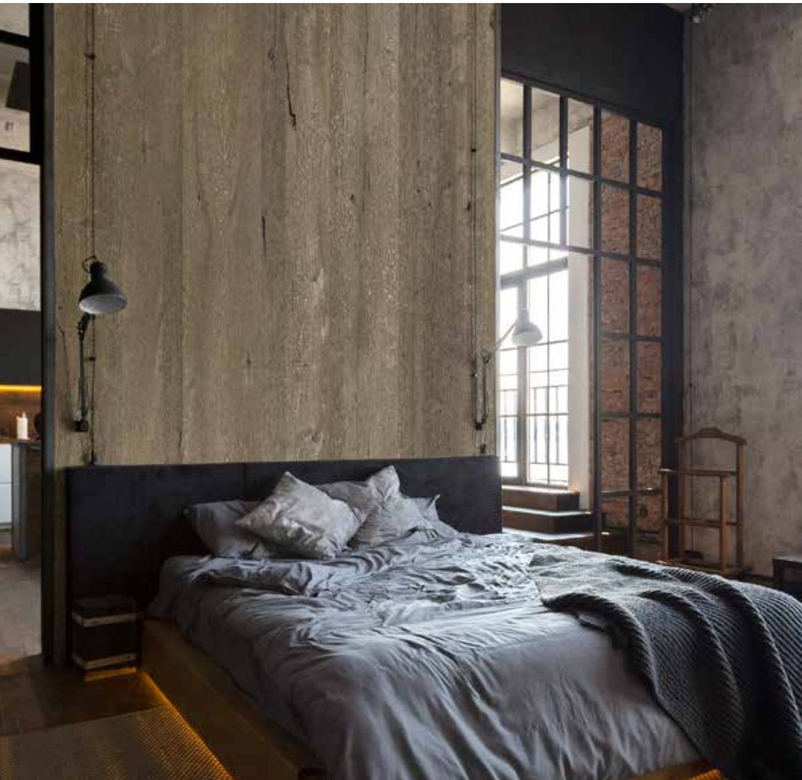
OAK VINTAGE INTENSE BALTIMORE - 3,5 mm - Embossed type E1 Afwerking: Olie mat