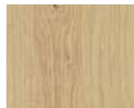
OAK NATURAL Vivace