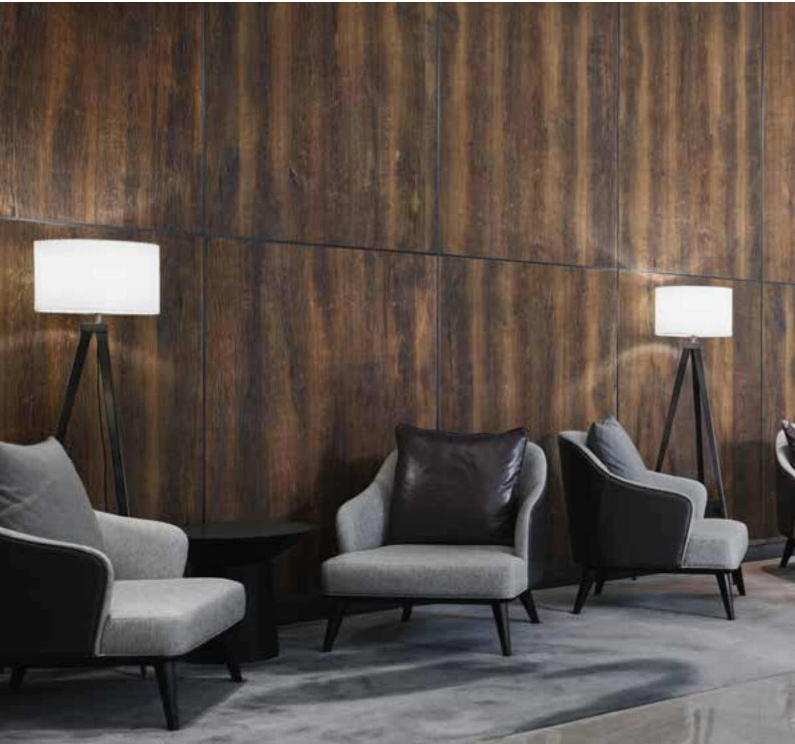
OAK VINTAGE INTENSE HOBOKEN - 3,5 mm - Embossed type E1 Afwerking: Olie met satijnglans