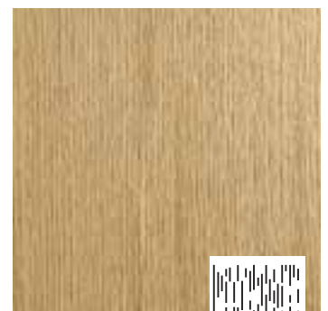
Brushed type B3