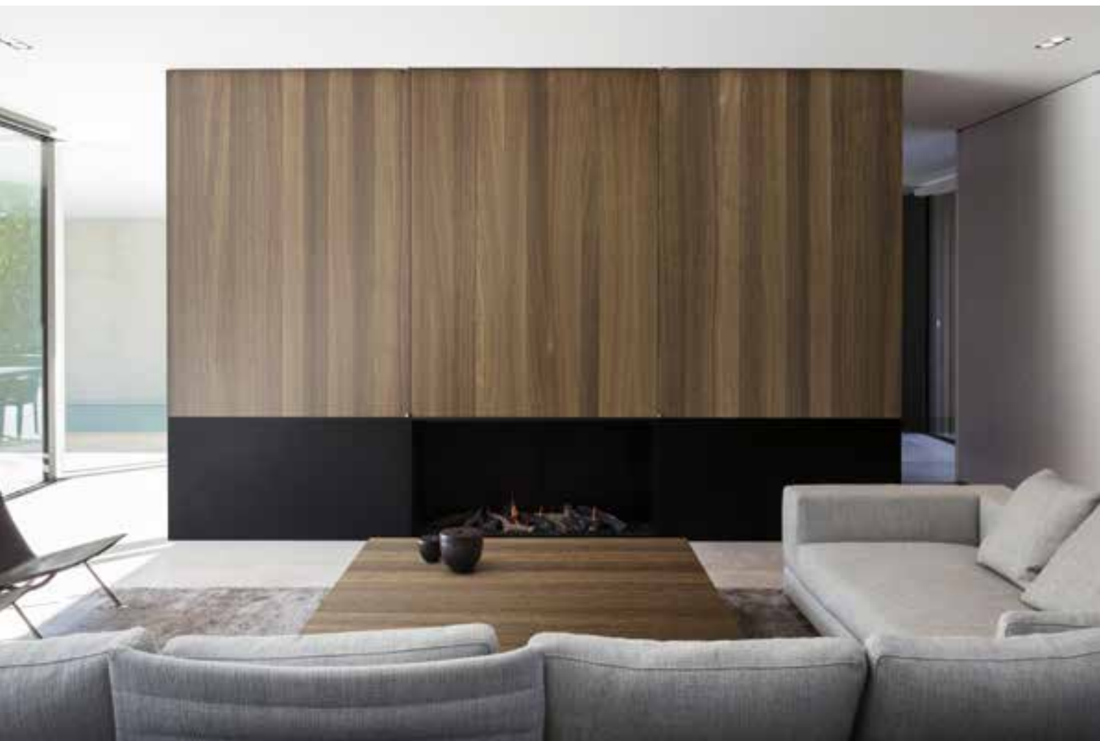
OAK SMOKED ARABICA - 1,5 mm - Brushed type B1 Afwerking: Vernis mat Ontwerp: Govaert & Vanhoutte