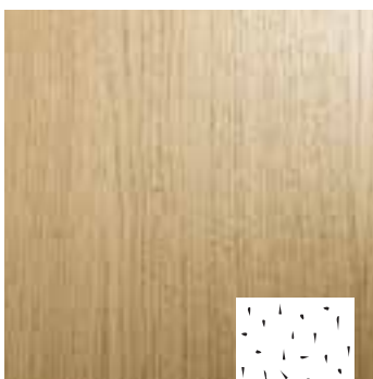
Distressed type D1

Door middel van willekeurig aangebrachte hamerinslagen wordt een grillig patroon gecreëerd waardoor het fineer een doorleefd uitzicht krijgt.