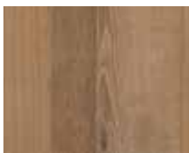
OAK VINTAGE RETRO Hoboken