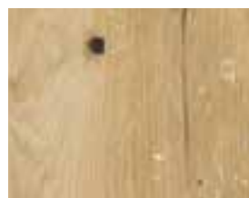
OAK VINTAGE INTENSE Harlem