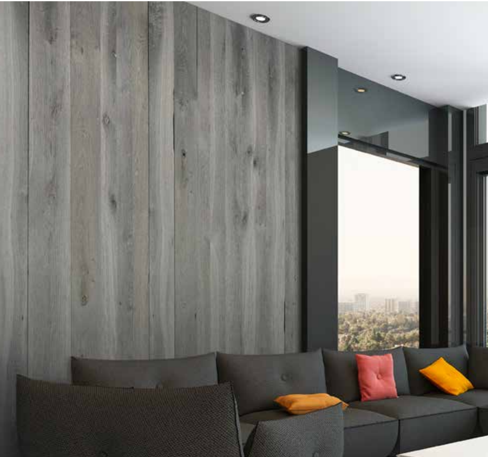
OAK VINTAGE ORIGINAL BALTIMORE - 1 mm - Brushed type B1 Afwerking: Olie mat