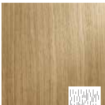
Brushed type B1

Een geborsteld oppervlak laat de natuurlijke houtstructuur beter tot haar recht komen. Brushed type B1: hierbij wordt het zachte zomerhout subtiel en lichtjes uitgeborsteld. Brushed type B2 en type B3: hierbij gaat de structuur meer in de diepte en kan het effect vergeleken worden met zandstralen.