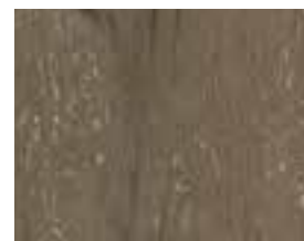
OAK VINTAGE INTENSE Baltimore