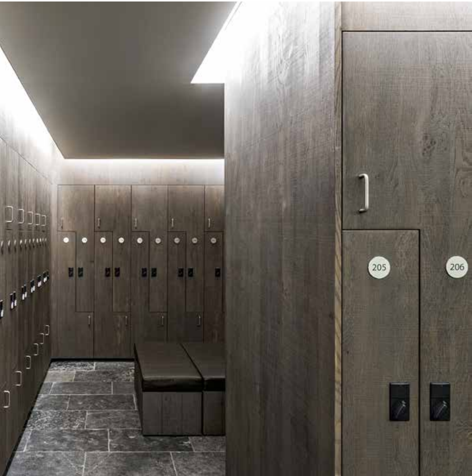
OAK NATURAL VIVACE - 1,5 mm - Scratched type S1 Afwerking: Gekleurde olie Ontwerp: 3Architecten Realisatie: De Laere Decor