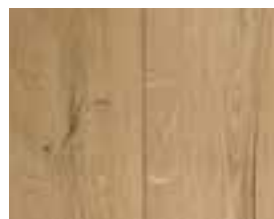
OAK VINTAGE ORIGINAL Harlem