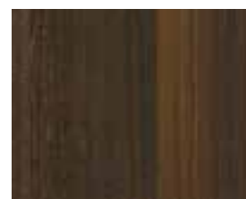
OAK SMOKED Robusta