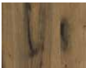
OAK VINTAGE ORIGINAL Hoboken