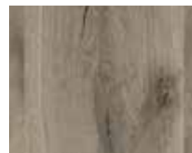
OAK VINTAGE ORIGINAL Baltimore