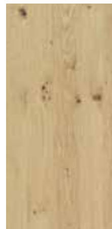
OAK NATURAL Vivace