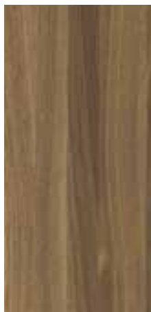
OAK SMOKED Arabica