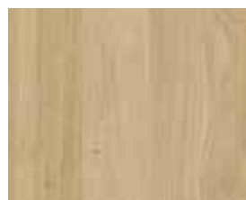
OAK VINTAGE RETRO Harlem