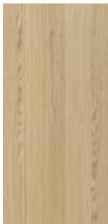
OAK NATURAL Allegro