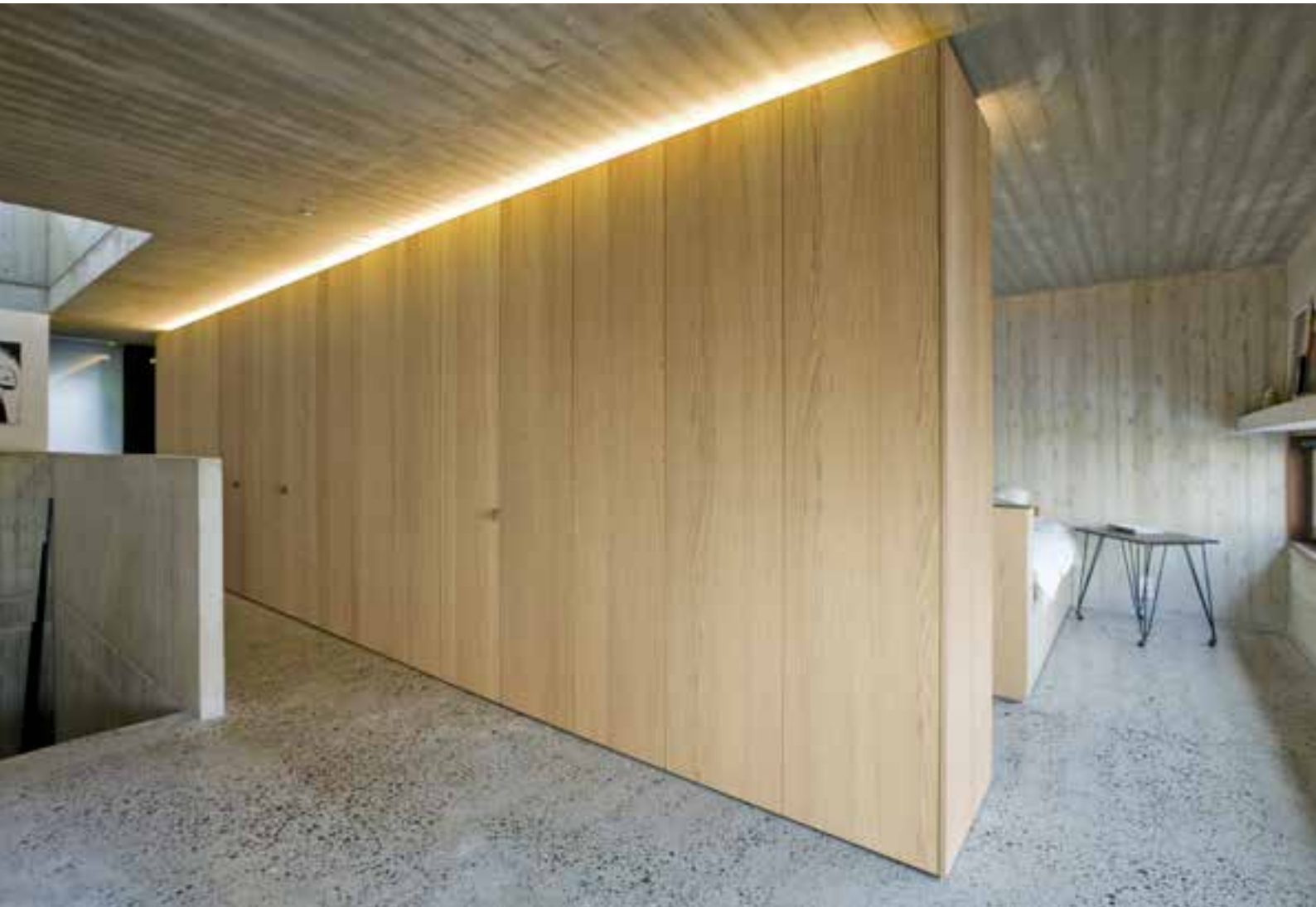
OAK NATURAL ALLEGRO - 0,6 mm - Brushed type B1 Afwerking: UV lak mat Ontwerp: Cuypers & Q architecten