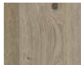
OAK VINTAGE RETRO Baltimore