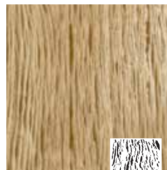
Embossed type E1

Onder hoge druk wordt een uitgesproken reliëfstructuur in de platen aangebracht. Hierdoor krijgt het oppervlak een verweerde look & feel.