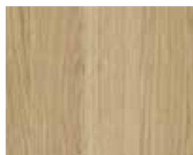
OAK NATURAL Allegro