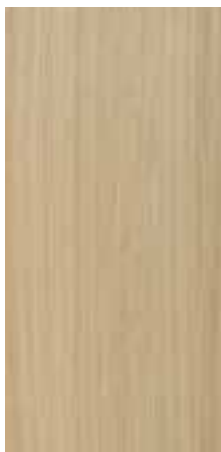
OAK NATURAL Adagio

De 3 looks van Oak Natural zijn verkrijgbaar in 4 fineerdiktes: 0,6 mm, 1 mm, 1,5 mm en 2 mm.