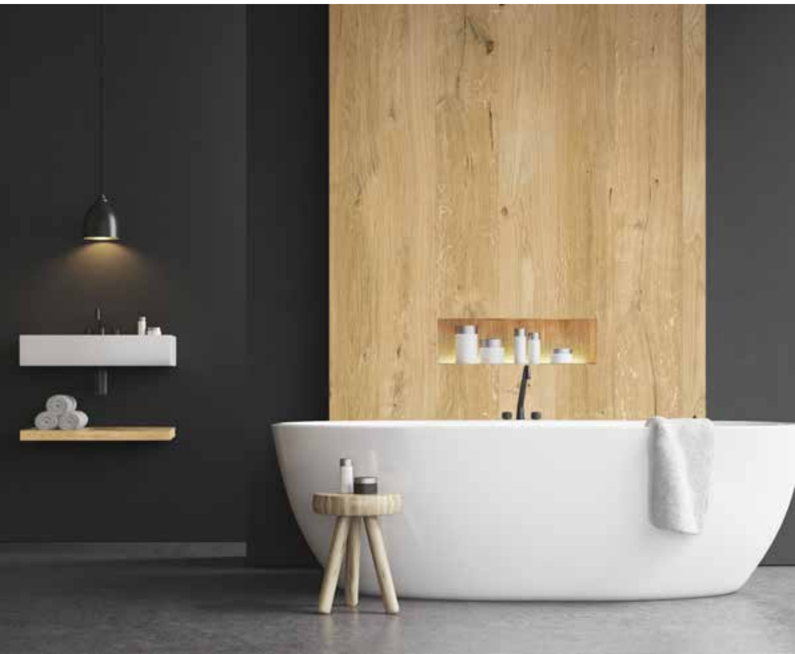
OAK VINTAGE INTENSE HARLEM - 3,5 mm - Embossed type E1 Afwerking: Olie mat