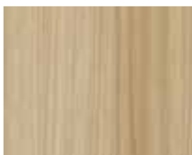
OAK NATURAL Adagio