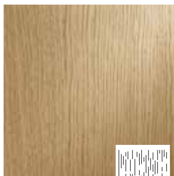
Brushed type B2