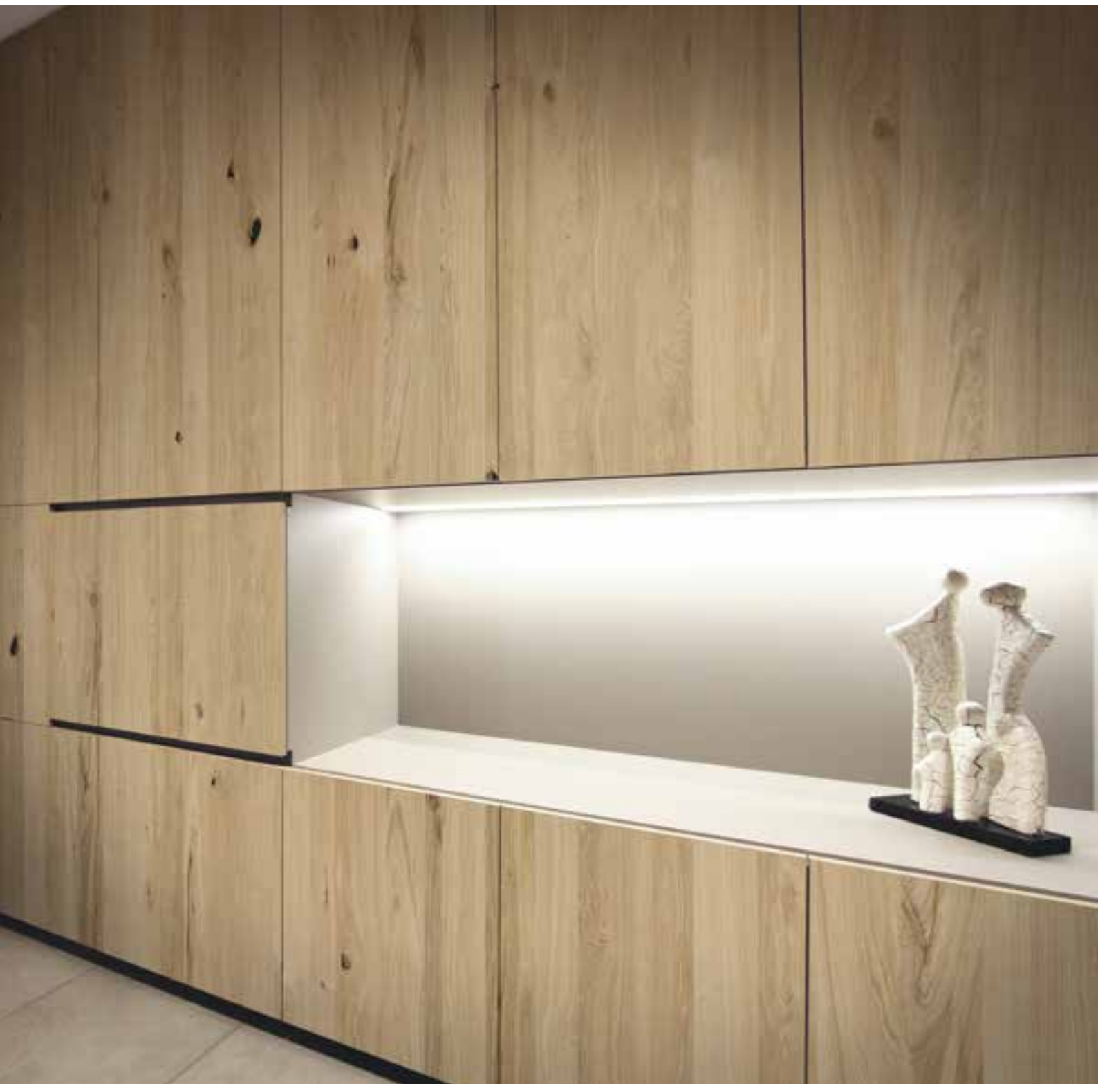
OAK VINTAGE RETRO HARLEM - 0,6 mm - Plain Verarbeitung: Mattlack Natureffekt Entwurf: Stijn Vandenberghe Realisierung: Pieter Vandenberghe