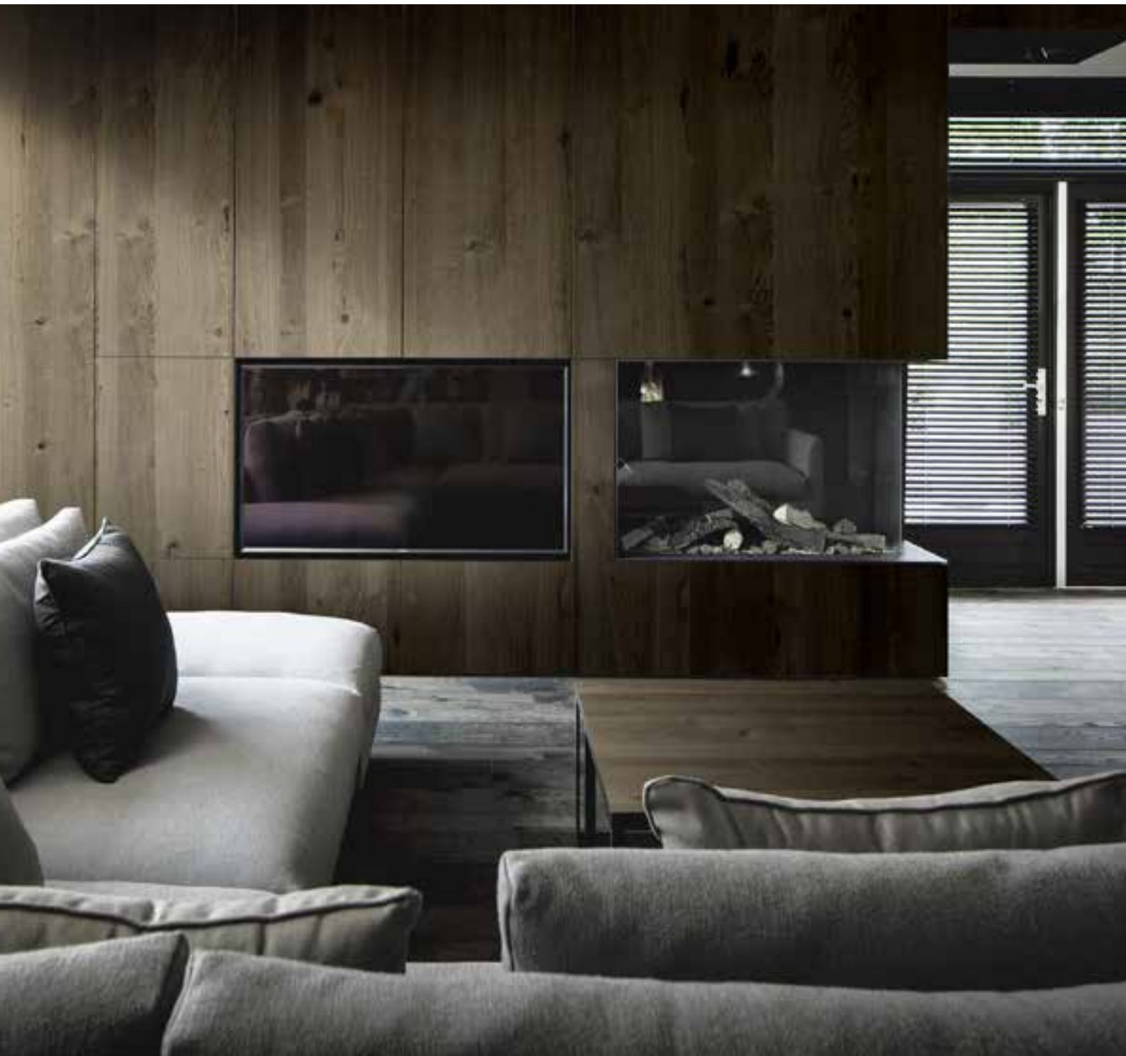
OAK VINTAGE RETRO BALTIMORE - 0,6 mm - Brushed Typ B1 Verarbeitung: Öl matt Realisierung: Van Venrooij Interieurbouw Entwurf: Bob Manders