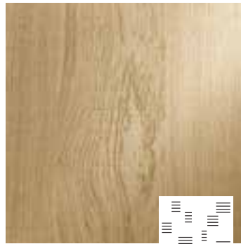
Scratched Typ S5

Kombinationsmöglichkeiten Look, Stärke und Touch