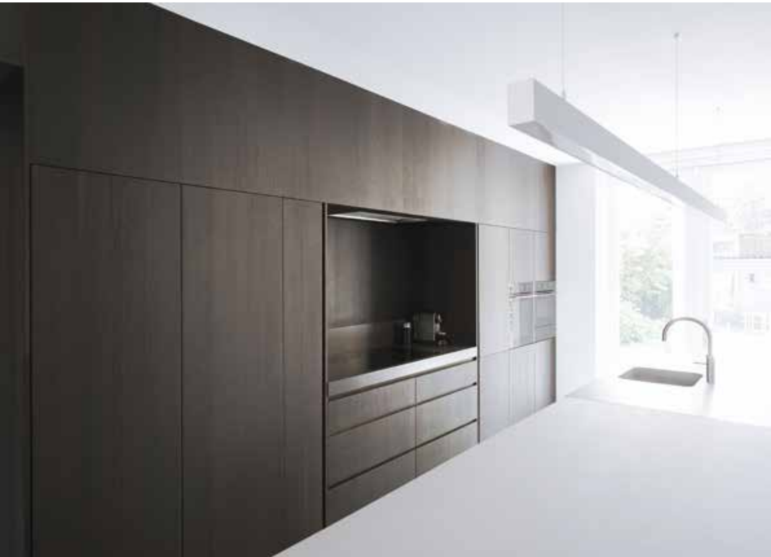
OAK SMOKED ROBUSTA - 0,6 mm - Brushed Typ B1 Verarbeitung: Mattweiß lackiert Projekt: Renovierung einer Villa, Utrecht, 2017 Entwurf: Serge Schoemaker Architects Realisierung: Vendel Keukenarchitectuur