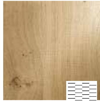
Scratched Typ S3