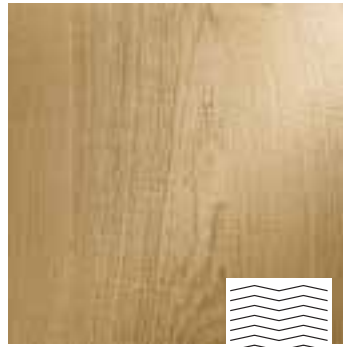
Scratched Typ S2