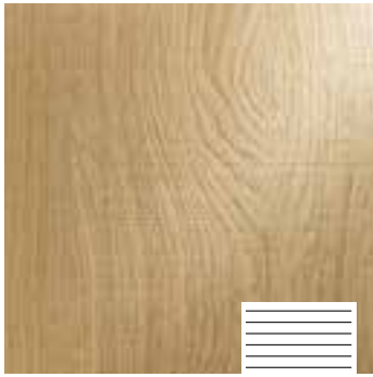
Scratched Typ S1

Einen authentisch wirkenden Bandsägeneffekt erreichen wir in einem patentierten Verfahren, mit dem die furnierte Platte das Aussehen einer handwerklich bearbeiteten Massivholzplatte erhält.