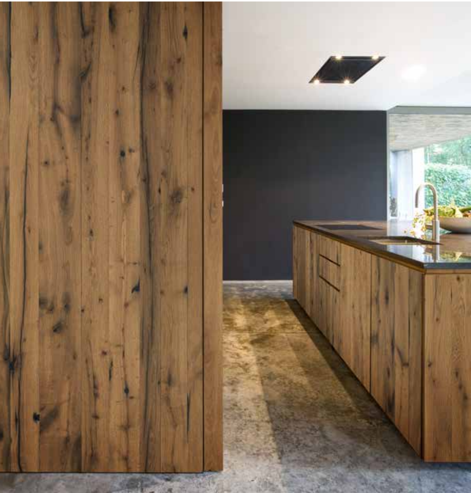
OAK VINTAGE ORIGINAL HOBOKEN - 1,5 mm - Brushed Typ B1 Verarbeitung: Öl matt Entwurf: Teema architecten